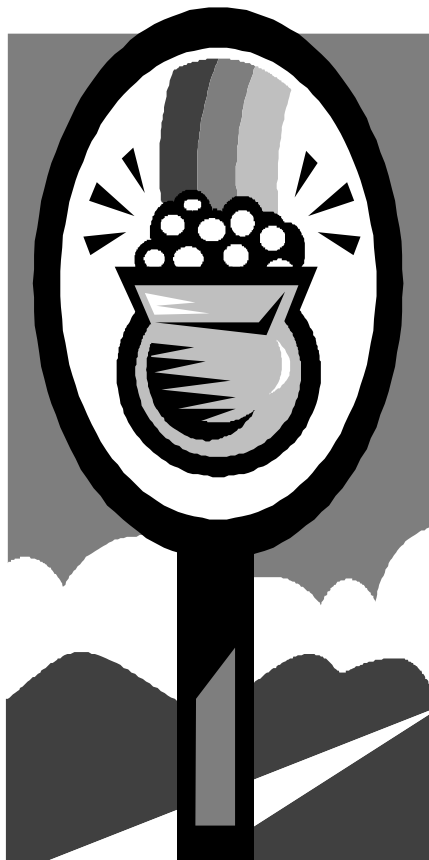
ett avtalspaket att ta ställning till