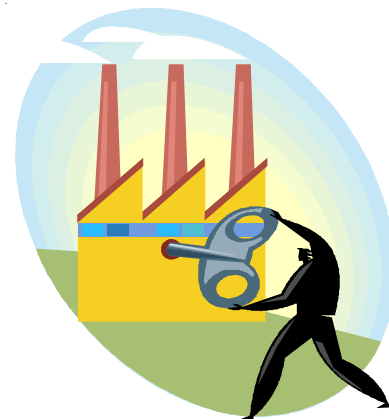
produktionstakten skruvas upp

Det finns ett kvarvarande behov av fler till Underhåll. Företaget har inte bestämt sig för hur man tänker gå vidare i frågan. I och med veckans förhandling har alla som tidigare arbetat inom Underhåll erbjudits